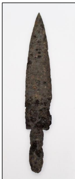
Figura 5 - Exemplar de uma ponta de flecha em ferro produzida e utilizada pelos Kaingang de São Paulo. Acervo da coleção Pedro Delvalle Fernandes, do Museu Histórico e Pedagógico Índia Vanuíre.

Sem indicação para o Estado de São Paulo, mas não obstante presente em relatos do Norte da Argentina (AMBROSETTI, 1985), as mulheres, além de enterradas em montículos, eram também enterradas com seus próprios utensílios. Como tal, a presença de vasos cerâmicos, dado o papel da mulher ceramista Kaingang, seria de se esperar nos seus enterramentos. No trabalho de Godoy (1947), foram identificados recipientes cerâmicos, e também remanescentes de adultos do sexo feminino. Porém a ausência de dados de campo acerca da possível relação in situ enfraquece a inferência de que esses dois elementos pudessem estar intrinsecamente relacionados. Apesar disso, a hipótese claramente não deve ser descartada.