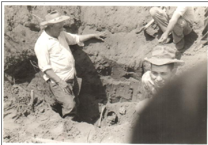
Figura 3 - Exumação do Túmulo 1 de Parapuã, de onde foram exumados um total de 33 indivíduos. Acervo do Museu Municipal de Parapuã.