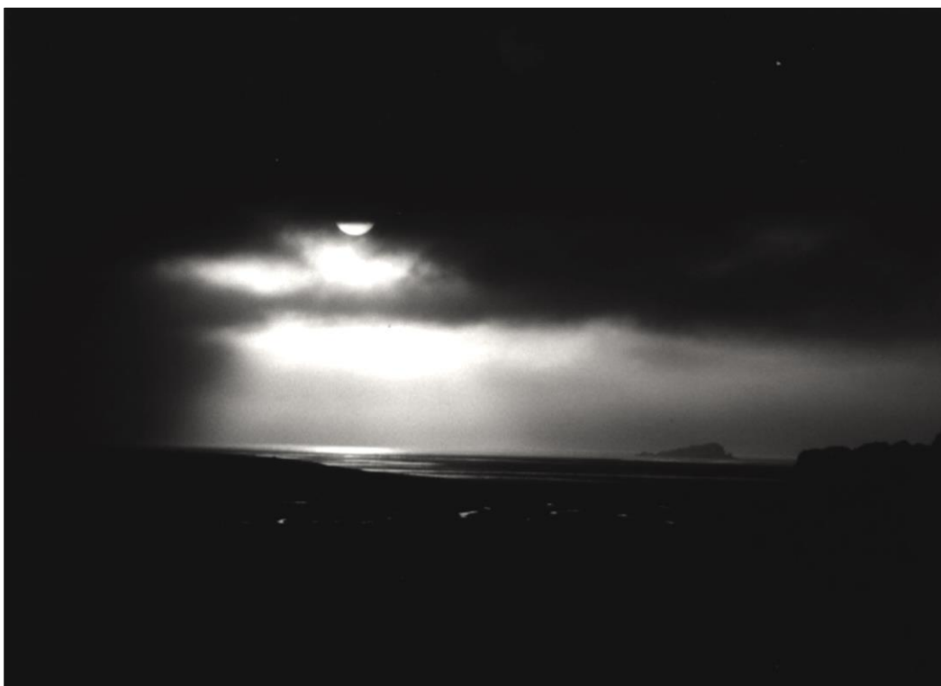
Figura 2 - Foto do primeiro anoitecer que contemplei na Antártica.

Se nosso objetivo como arqueólogos é contar histórias, principalmente sobre os grupos subalternos/invisíveis que tem ficado de fora das “máster narrativas” (FUNARI et al., 1999; JOHNSON, 1996; ORSER, 1996), por que paradoxalmente, neste processo de conhecimento, nos auto-excluimos das histórias que construímos, e criamos um novo grupo de personagens invisíveis?, “os próprios arqueólogos”.