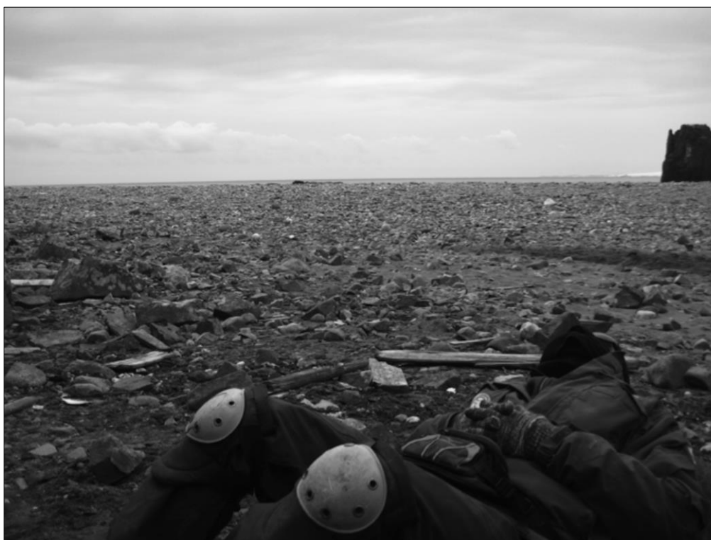
Figura 3 - Eu, sonhando na Antártica (Byers, 2011).

Chego ao final deste artigo e penso o que um arqueólogo ortodoxo provavelmente diria depois de ler o que escrevi: E o que isso tem a ver com